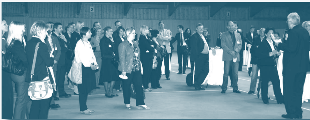
Moderierte Gesprächsrunde in der Tennishalle