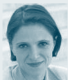
Karin Bauer Der Standard

Wir bedanken uns bei den Mitgliedern des Fachbeirats für die wertvolle Unterstützung bei der Entwicklung der PoP 2010.