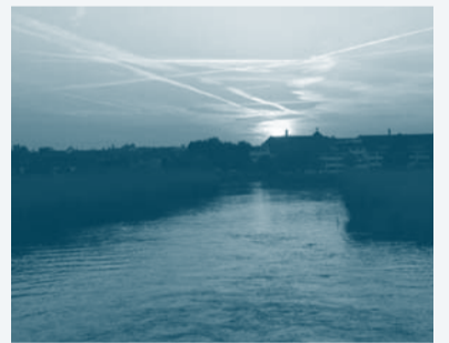
Das Seehotel Rust im Sonnenuntergang